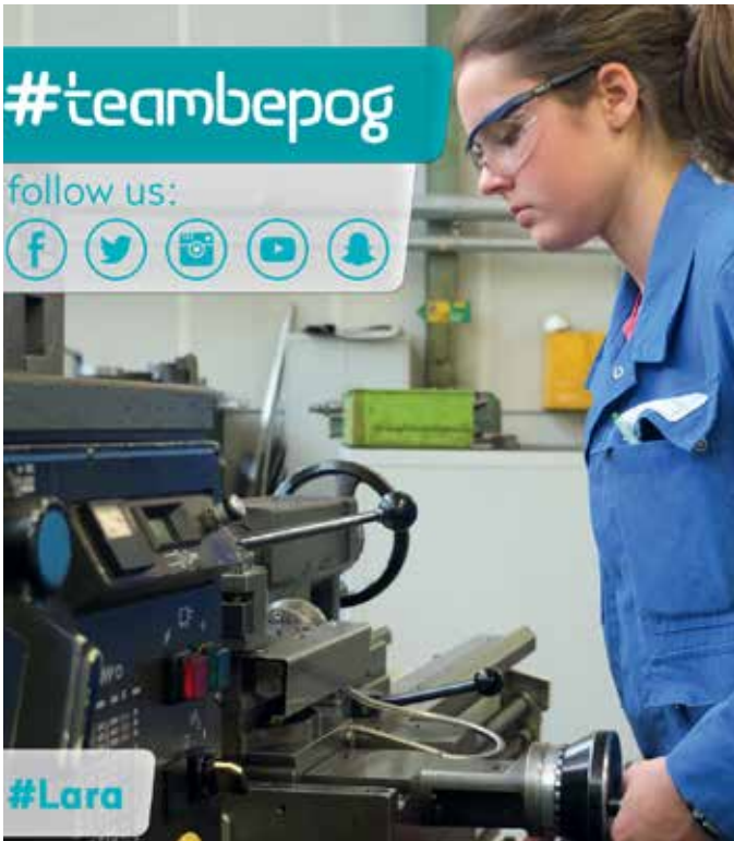
Les membres du team #bepog au travail dans leurs apprentissages. Die Mitglieder des #bepog-Teams bei der Arbeit auf ihren jeweiligen Lehrstellen. The members of the team #bepog to work in their learning.

Discussions are under way to maximize the distribution of #bepog information sheets. The #bepog office (contact@bepog.ch) can also send card sets to everyone interested.